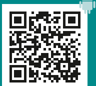
A.R.T. App für Android