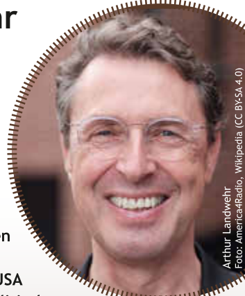
Arthur Landwehr

Mit Spannung blickt die Welt auf den Ausgang der amerikanischen Präsidentschaftswahlen im Herbst. Schaffen es die Demokraten und Joe Biden ein weiteres Mal, ihre Ideen von Freiheit und Verantwortung gegen den Populismus der Republikaner à la Donald Trump zu verteidigen?