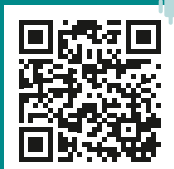
A.R.T. App für Android