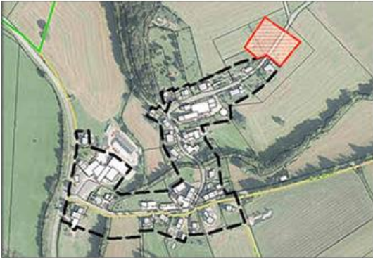
Lage des Plangebiets in der Ortslage Halenfeld (rot umrandet)

Die Lage des Plangebiets und der Geltungsbereich sind aus den nachfolgenden, unmaßstäblichen Kartenunterlagen ersichtlich.