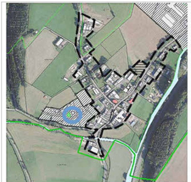
Lage des Plangebiets innerhalb der Ortslage (O)

Die Lage des Plangebiets und der Geltungsbereich sind aus den nachfolgenden, unmaßstäblichen Kartenunterlagen ersichtlich.