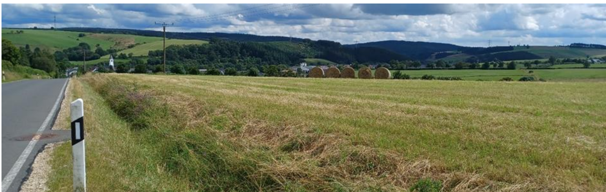
Blick von Norden auf die Fläche, vor und nach der Mahd.