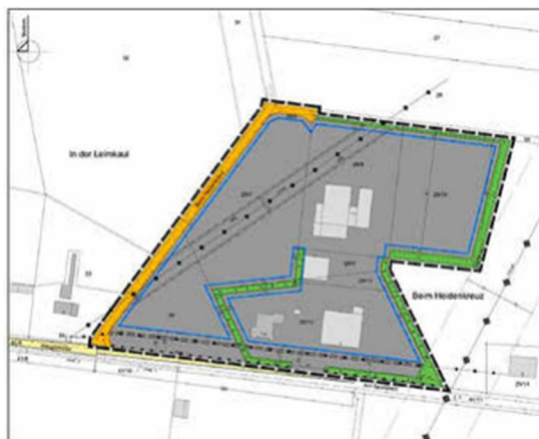
Geltungsbereich des Plangebiets (---)