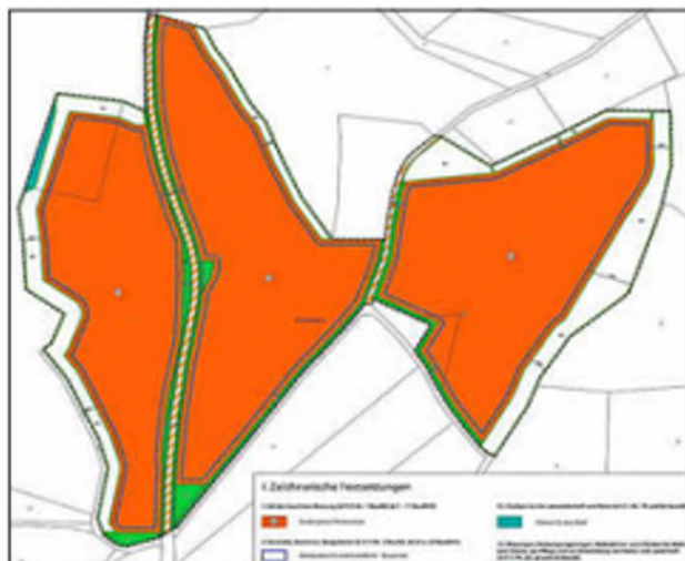
Auszug aus der Planurkunde (- - - Geltungsbereich)