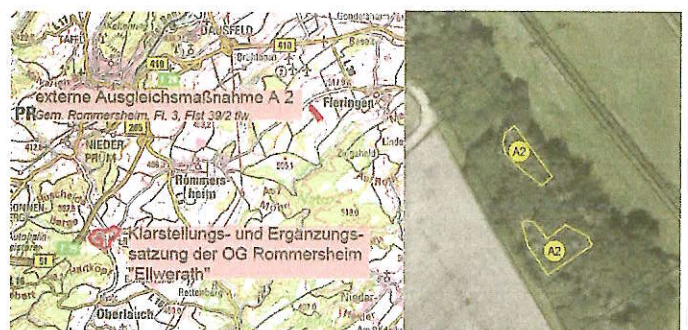
Lage der externen Ausgleichsmaßnahmen