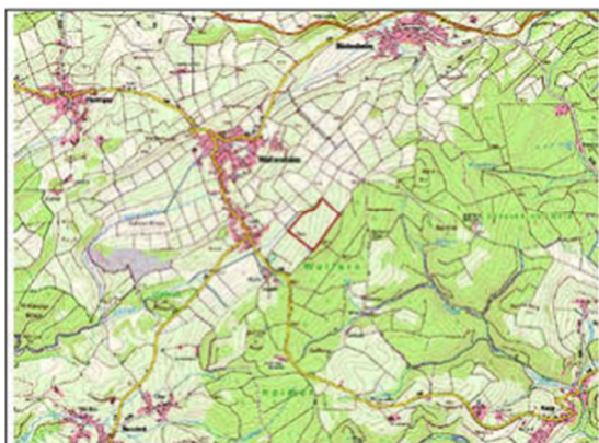
Lage des Plangebiets (rot umrandet)

Die Lage des Plangebiets und der Geltungsbereich sind aus den nachfolgenden, unmaßstäblichen Kartenunterlagen ersichtlich.