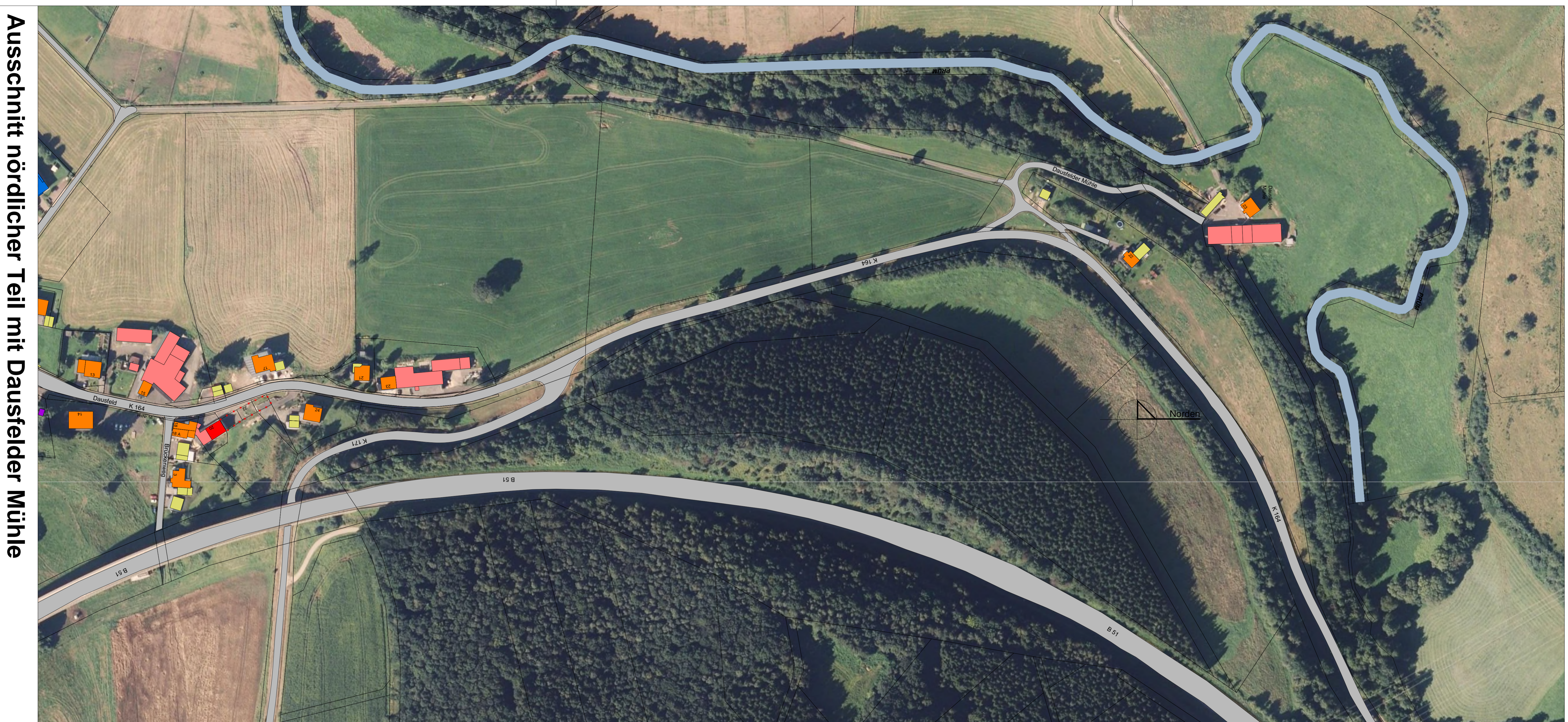
Ausschnitt nördlicher Teil mit Dausfelder Mühle