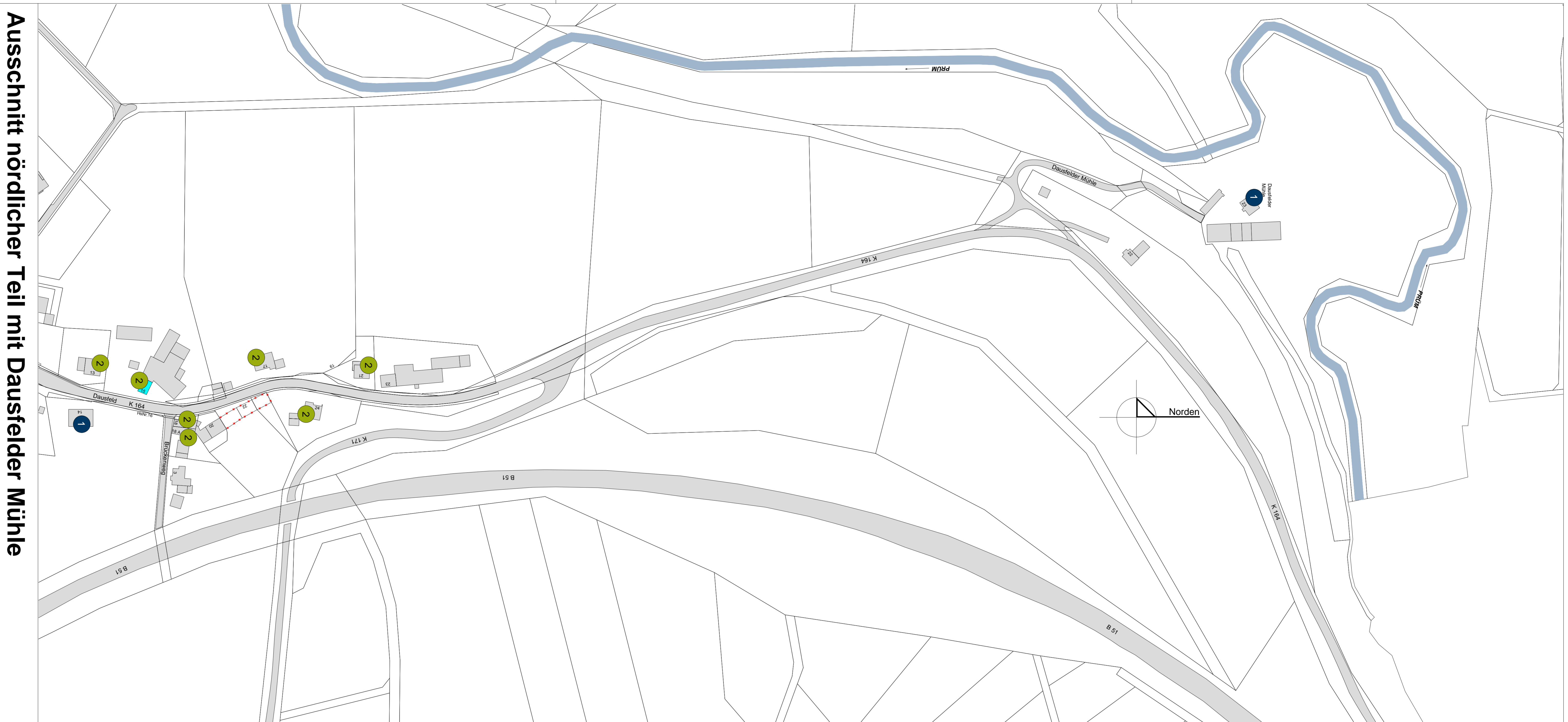
Ausschnitt nördlicher Teil mit Dausfelder Mühle