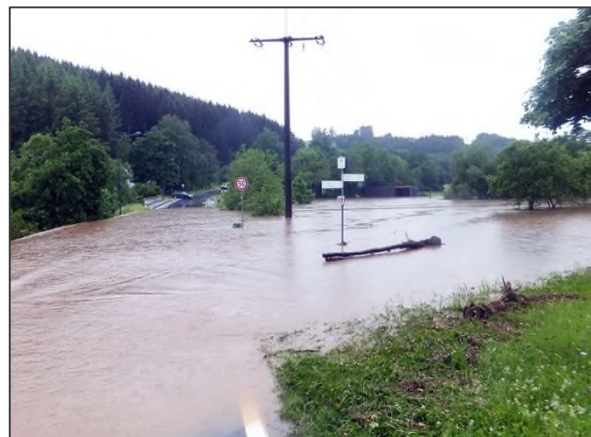
Abbildung 2.3: Überflutung des Alfbachs