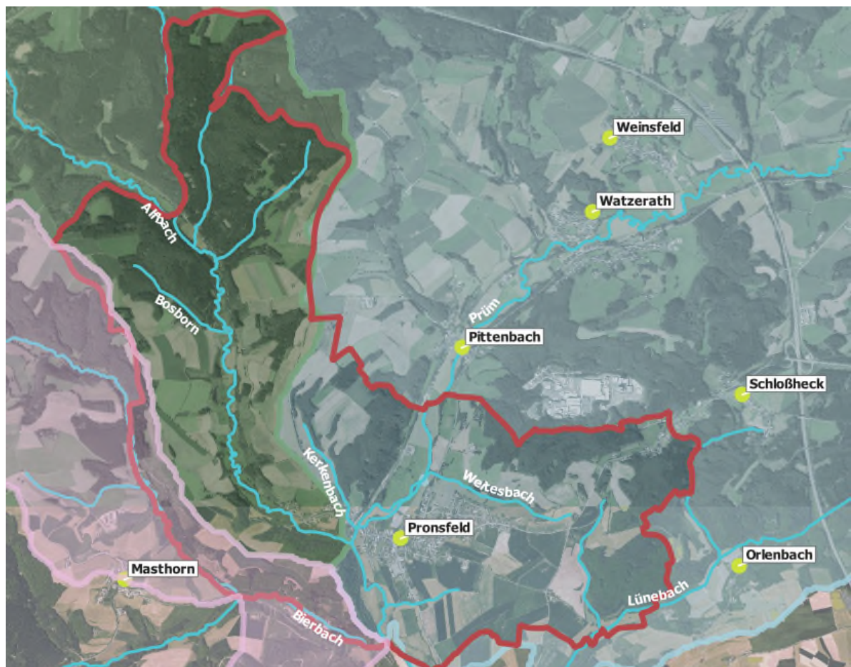
Abbildung 2.1: Relevante Einzugsgebiete

Die Zuflüsse teilen die Ortsgemeinde in verschiedene Einzugsgebiete auf. Ein Einzugsgebiet ist das geografische Gebiet, von dem aus Niederschlag und Oberflächenwasser zu einem bestimmten Punkt fließen. Ein Einzugsgebiet wird durch topografische Merkmale wie Gebirgszüge, Hügel und Wasserscheiden definiert. Die Karte in Abbildung 2.1 zeigt die relevanten Einzugsgebiete in der Gemeinde. Die Verortung der Wasserscheide zwischen Einzugsgebieten ist vor allem relevant, weil sie es beim Entwickeln von wasserwirtschaftlichen Maßnahmen ermöglicht, zu identifizieren, in welchem Ausmaß diese Maßnahmen einen Einfluss auf den Abflussbereich haben.