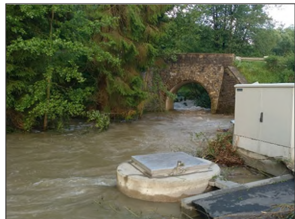
Abbildung 2.2: Zerstörungen an der Infrastruktur