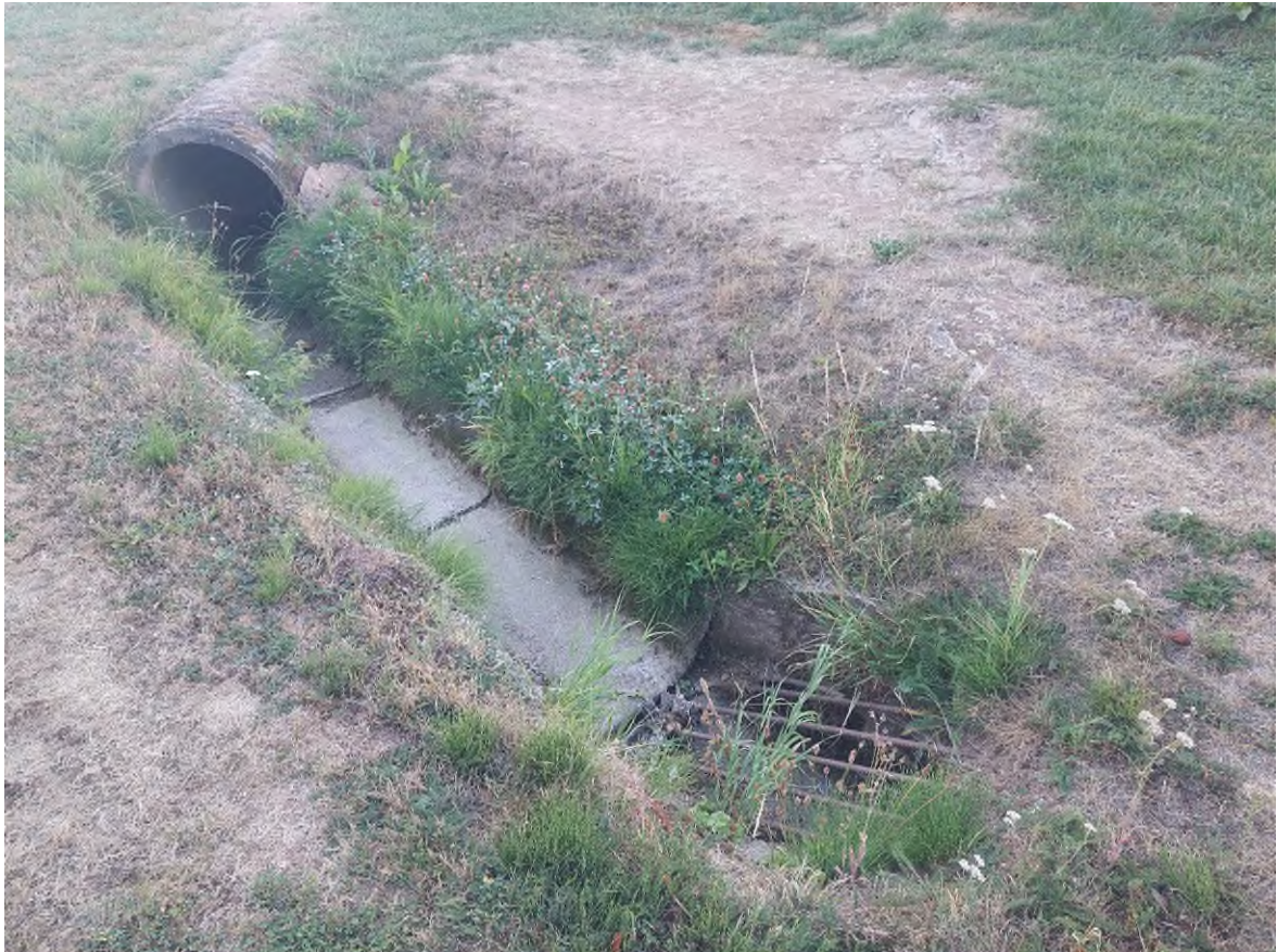
Abbildung 7.1: Offenes Gerinne der Nussbachverrohrung

300 abführen. Das Wasser fließt dadurch oberirdisch weiter in Richtung Wohnhäusern und überflutet den Gebäuden.