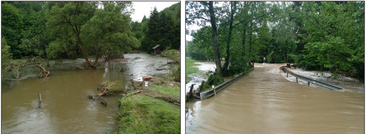
Abbildung 2.3: Überflutung der Our