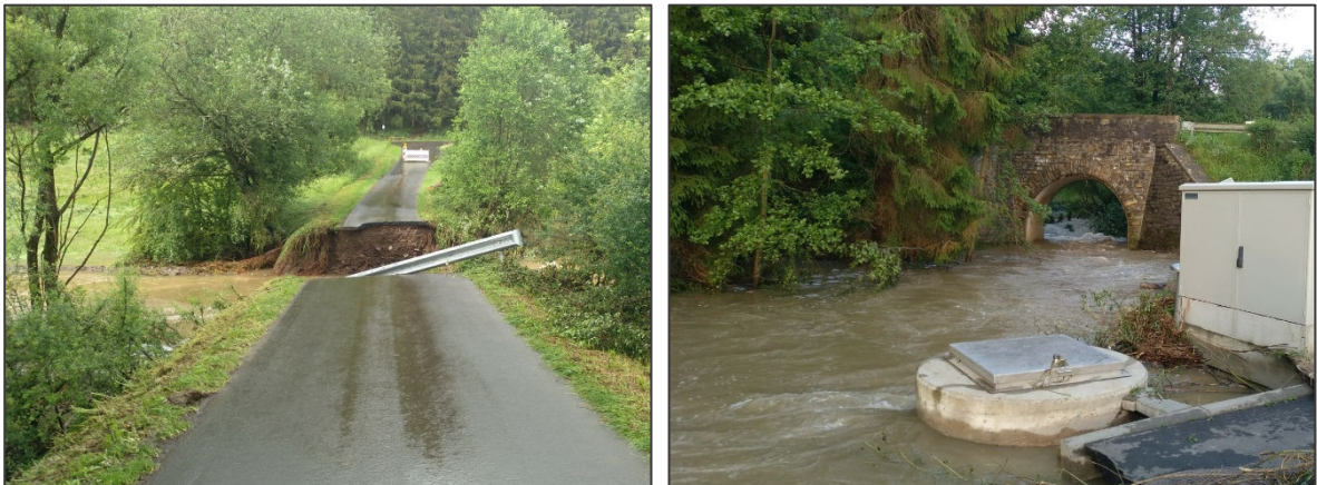
Abbildung 2.2: Zerstörungen an der Infrastruktur

Nachfolgend sind einige ausgewählte Schadensbilder dargestellt: